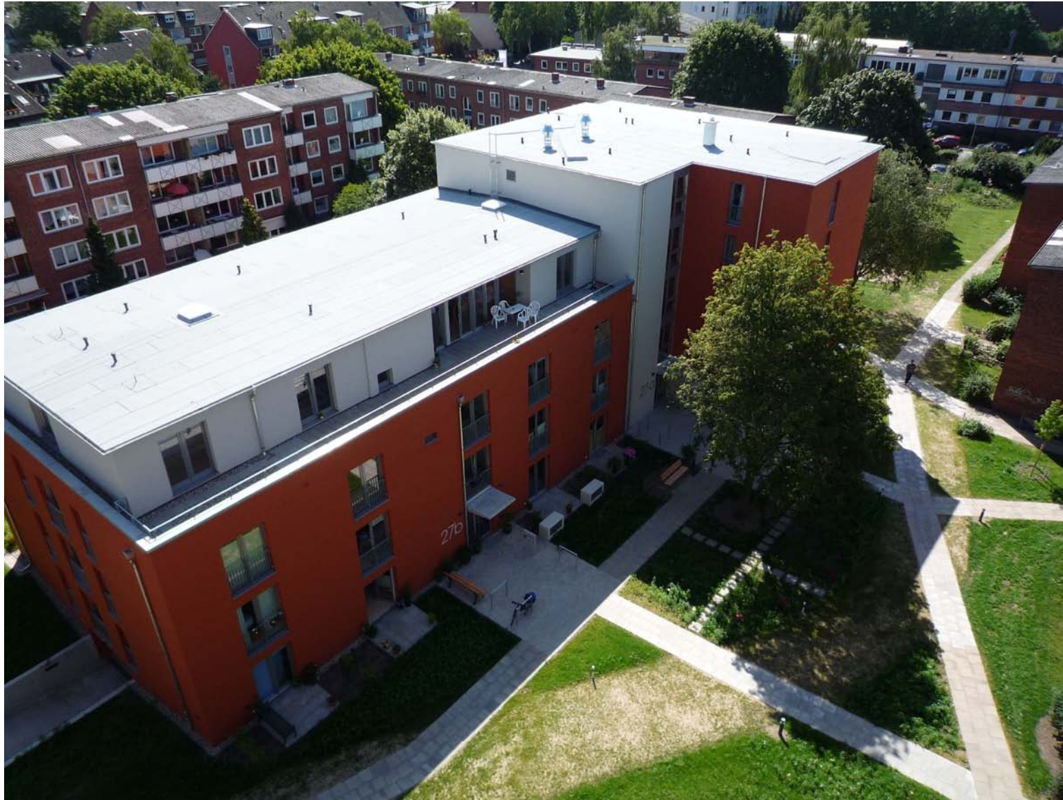
2009 Neubau in Hamburg Hinschenfelde für: Senioren, Menschen mit Behinderung, Menschen mit Demenz-Erkrankung Wohn-Pflege-Gemeinschaft mit 9 Zimmern, Wohnungen, Gemeinschaftsräume, Treffpunkt und Büro des Pflegedienstes