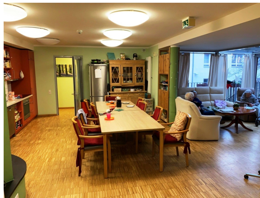
Esstisch und Wintergarten