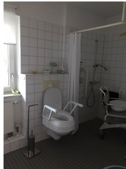
Barrierefreies Bad des Zimmers Großer Flur mit Einbauschränken